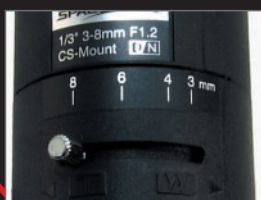
「焦点距離スケール」

新フェニックスには新たにズーム調整の際に便利な「焦点距離スケール」を標準装備しました。お好みの焦点距離に調整が可能です。